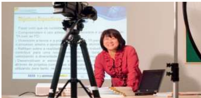
O PAPEL DO MESTRE - Professora grava aula na Unesp: conexão com o aluno