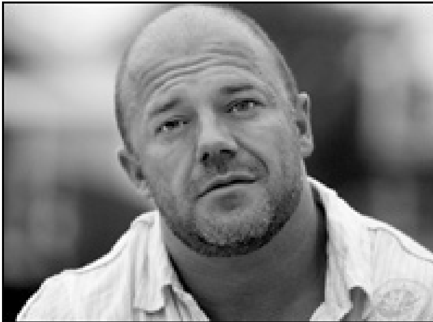
Andrew Sullivan - Provincetown, Massachusetts .As heard on NPR's Morning Edition , July 4, 2005

Although born and raised in England, writer Andrew Sullivan turns to America's Declaration of Independence to find his beliefs rooted in the principles of "life, liberty and the pursuit of happiness."