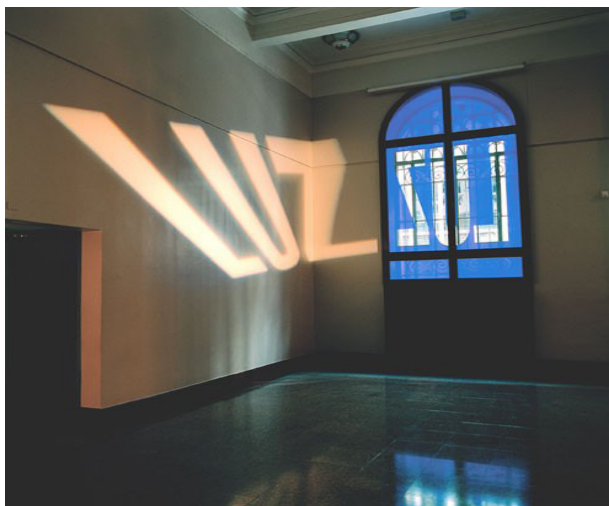
LUZ/ZUL, "Claraluz" (Regina Silveira, (Centro Cultural Banco do Brasil, 2003,São Paulo )