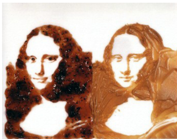
Vik Muniz. Double Mona Lisa after Warhol, 1999.