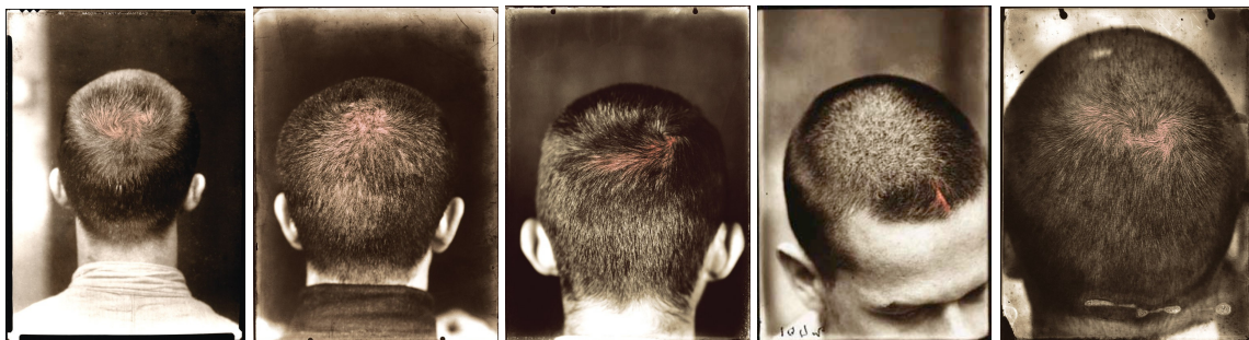
Rosângela Rennó. Série Vulgo. 1998.

Disponível em: http://www.rosangelarenno.com.br/obras/exibir/16/2 >.