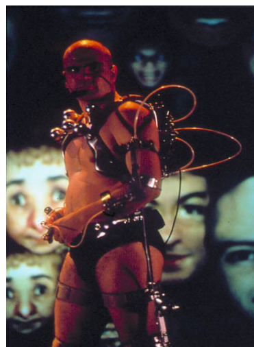
PERFORMANCE. Marcel-Ií Antunez Roca. Interactive Mechatronic, 1999.