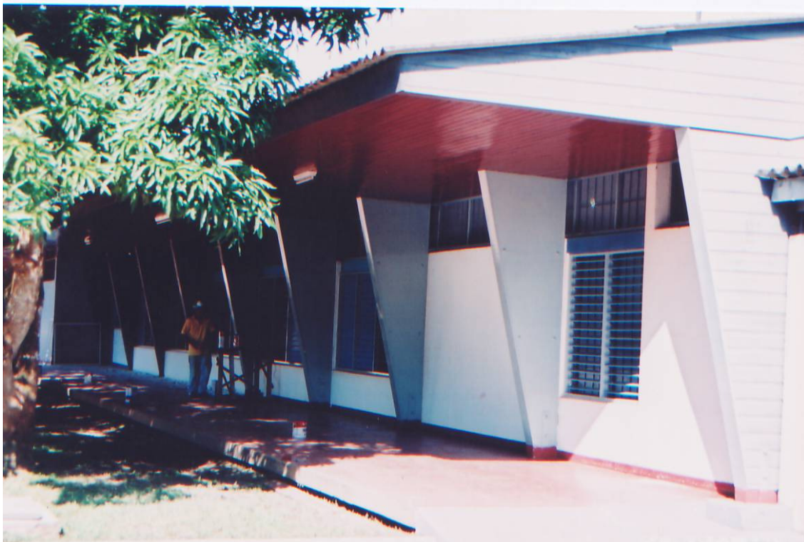
Hotel da Vila Amazonas – Prédio do Restaurante e Boate (Santana-AP) – Fachada Principal Autor do Projeto: Oswaldo Bratke.

No período compreendido entre 1960 a 1970 institucionalmente podemos citar uma taxa média de crescimento anual de 5,37% para o Amapá, comparando-se com a do Brasil em 2,89% e da região Norte em 3,47%. Nota-se assim um crescimento populacional considerado, isto relacionado à institucionalização do território em data bem anterior e à instalação dos dois grandes empreendimentos: ICOMI e o Complexo Jari. Ligado ao primeiro veio o nascimento da então Vila Serra do Navio e a Vila Amazonas, no Município de Santana.