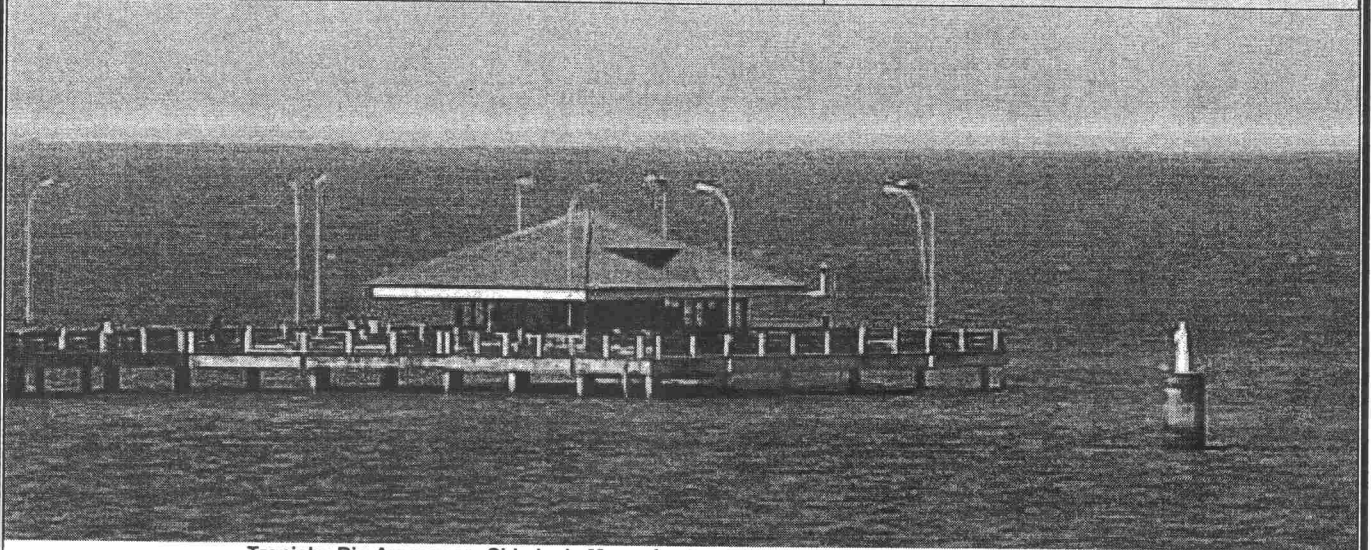
Trapiche Rio Amazonas, Cidade de Macapá – Amapá